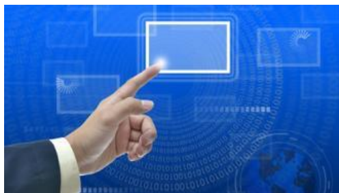
+ Iab Forum

Erano seguite altre esperienze in Matrix Spa e nel consiglio di amministrazione di AudiWeb, poi il